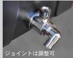
ジョイントは調整可